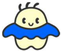
科学館マスコット キャラクター：アサラ

職員による説明 (15分) プラネタリウム鑑賞 (50分) 特別展見学・昼食 (90分)